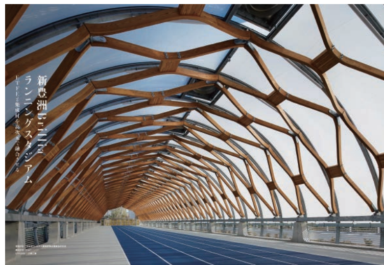
新豊洲Brilliaランニングスタジアム