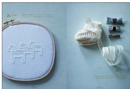
ドロンワークの小物