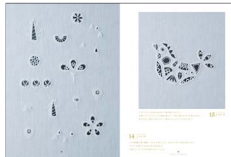
ヘデボ刺繍の図案