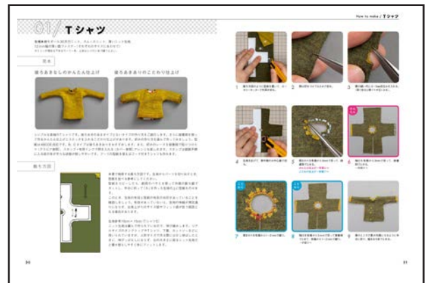
▲作り方ページは、写真プロセスでていねいに解説