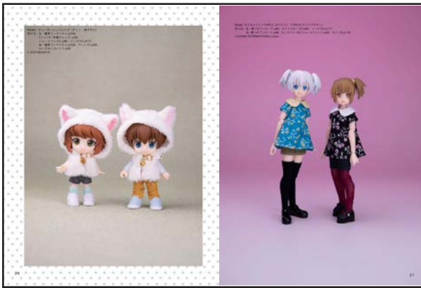
▲さまざまなタイプの1/12スケールサイズに対応