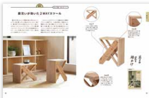
作品の概要と製作上のポイント解説

加工が容易な杉の板材とベニヤ板で作る、椅子・テーブル・収納家具24点を収録。工業デザイナーならではの機能美にあふれるデザインは、半世紀たったいまも色あせない。家具製作の基本や構造を学ぶための教材、針葉樹を利用したワークショップの題材としてもおすすめ。