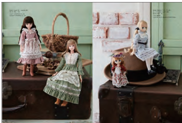
▲モデルドールは11、20、22、27cmの4種類

定価:1,500円(税別) ISBN978-4-7661-3240-3 C0072 B5判・並製 112ページ