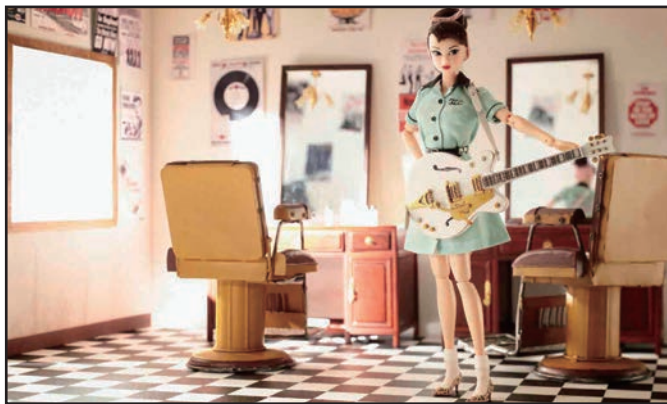
▲11体のUNUSUAL(型にはまらない)な音楽ずきの女の子をイメージした作品

関口妙子 著 定価：3,000円(税別) ISBN978-4-7661-3173-4 C0072 B5変判・上製