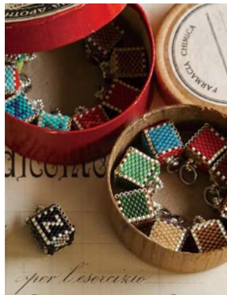
立体プチボックス