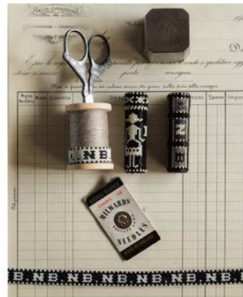
立体ニードルケース