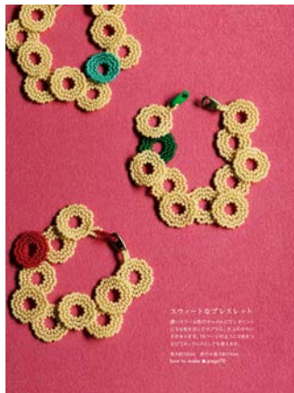
まるのプレスレット