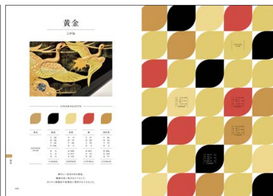
[左] 和の伝統色「朱」 [右] 和の伝統色「黄金」